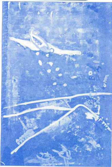
Francesco Salvi: "Boom Boom (Reostato)", 2017, tecnica su tela