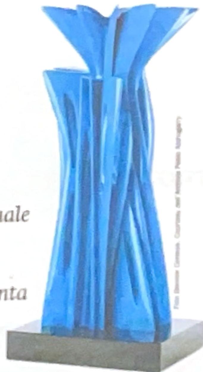
Pablo Atchugarry, «Senza titolo», 2026