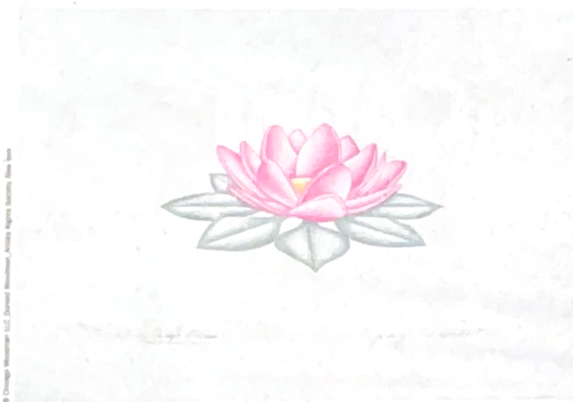
Judy Chicago, «Judy's Lilies», 2025

Ho creato «An Homage to Arles» nel 2024 nell'ambito della mia mostra al Luma. Si trattava di