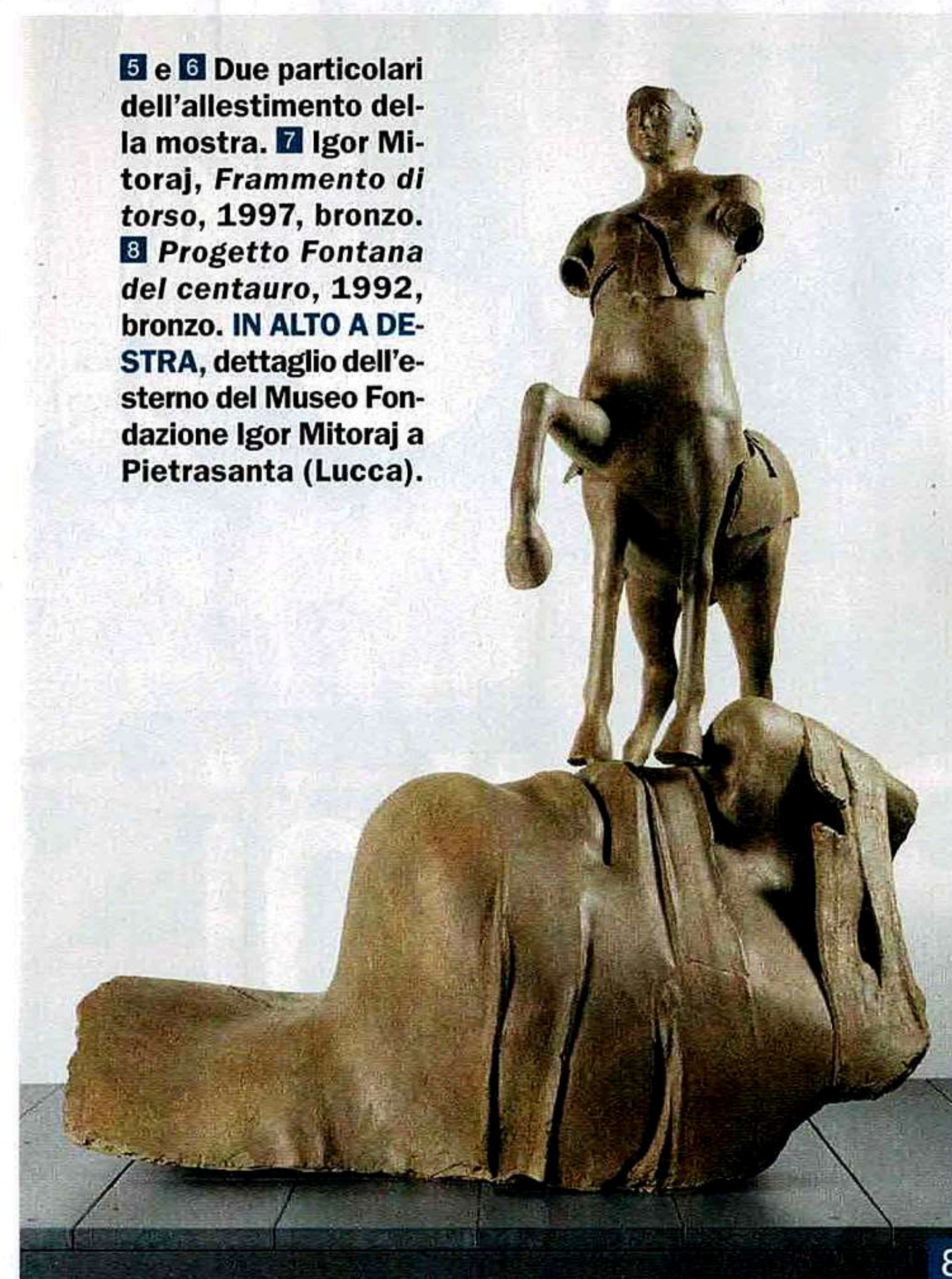
5 e 6 Due particolari dell'allestimento della mostra. 7 Igor Mitoraj, Frammento di torso , 1997, bronzo. 8 Progetto Fontana del centauro , 1992, bronzo. IN ALTO A DESTRA, dettaglio dell'esterno del Museo Fondazione Igor Mitoraj a Pietrasanta (Lucca).