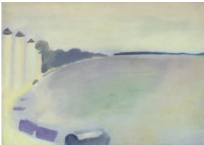
VIRGILIO GUIDI VENEZIA RIVA DEGLI SCHIAVONI OLIO SU TELA 50 X 70 CM