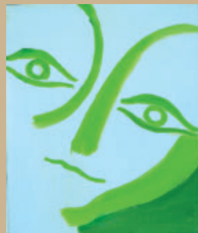
VIRGILIO GUIDI GRANDE TESTA 1970 OLIO SU TELA 60 X 50 CM