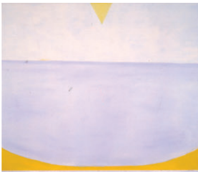
VIRGILIO GUIDI MARINA SPAZIALE 1977 OLIO SU TELA 150 X 182 CM

to find yourselves the infinite relationships linking their lives in the past and that could link our future today. "Il tempo o logora le relazioni o le chiarisce a se stesse" (Time either ruins relationships or clarifies them to themselves) (V.Guidi 1963). I believe this exhibition is a fundamental contribution to their clarification.