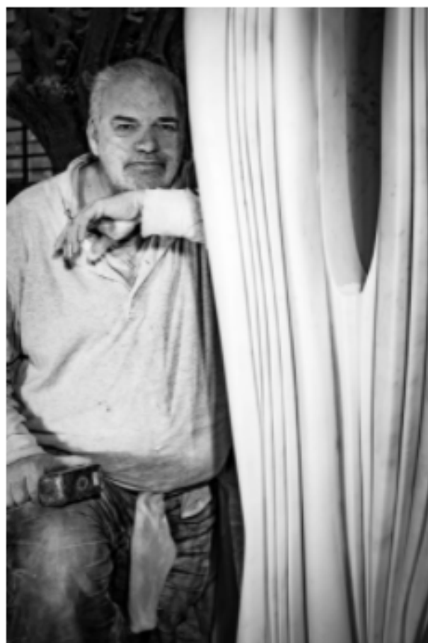
Pablo Atchugarry ritratto

Nel 2018 crea la Fondazione Pablo Atchugarry di Miami ed è tuttora in corso di realizzazione la costruzione di un grandissimo museo d'arte contemporanea nel predio della Fondazione a Punta del Este, non lontano da Montevideo sua città d'origine.