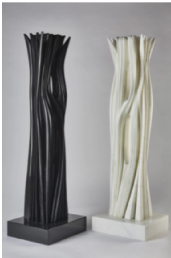
Harmonie (diptych), 2021. Statuary Carrara marble, Belgian back marble, n. 2 x 119 x 27 x 22 cm. © Daniele Cortese

La mostra vuole essere un punto di riflessione e un omaggio alla grande carriera di Pablo Atchugarry, scultore che con la sua notorietà internazionale, il curriculum delle esposizioni, la presenza nelle collezioni più importanti del mondo, e i suoi risultati di mercato planetari, costituisce il vero esempio di un artista che ha saputo concentrare nel suo lavoro il gusto globalizzato di tutti i collezionisti e gli esperti del mondo. Un'attività che nell'ultimo ventennio si è concentrata su grandi sculture in marmo - tutte lavorate e scolpite personalmente - che ora, nell'ambito dell'ultimissima produzione, stanno lasciando il posto a delle riflessioni sempre sulle forme sinuose e lineari della natura, ma scavate direttamente nel legno o emergenti da tronchi di ulivi secolari.