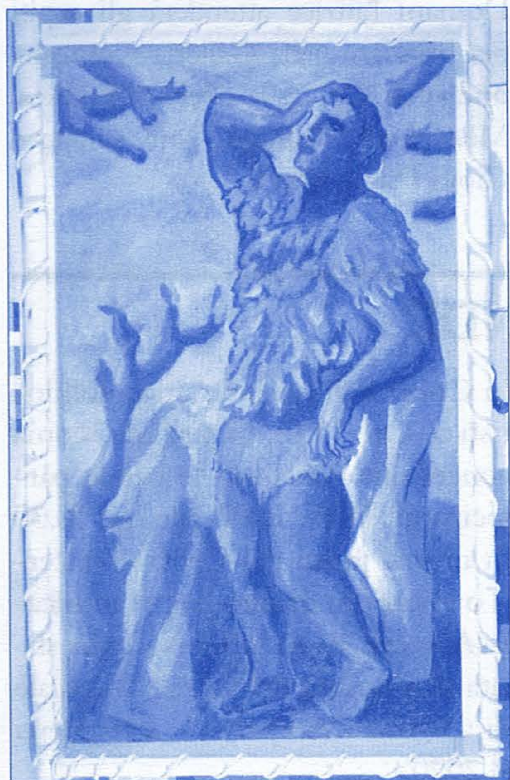
Sandro Chia: "Sudden Inspiration", 2004, olio su tela cm 193x112,5

Degne di interesse anche le due opere "Sudden Inspiration", 2004, olio su tela cm 193x112,5 e "Di corsa con l'Angelo", 2012, olio su tela, cm 100x80 del maestro della Transavanguardia,