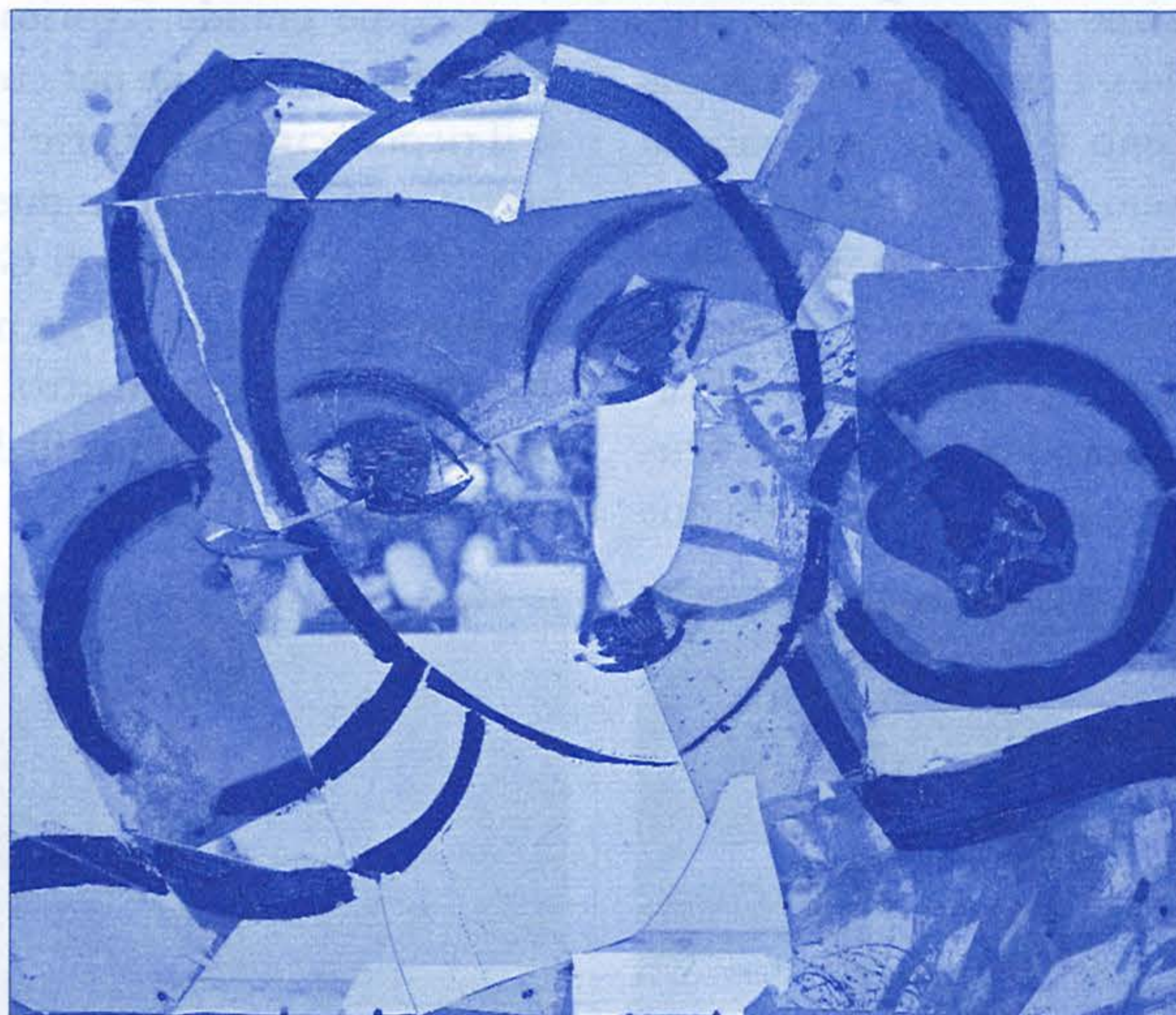
Manolo Valdés: "Matisse comò pretexto con Rosa y espejo" (2018), tecnica mista, cm 141x166