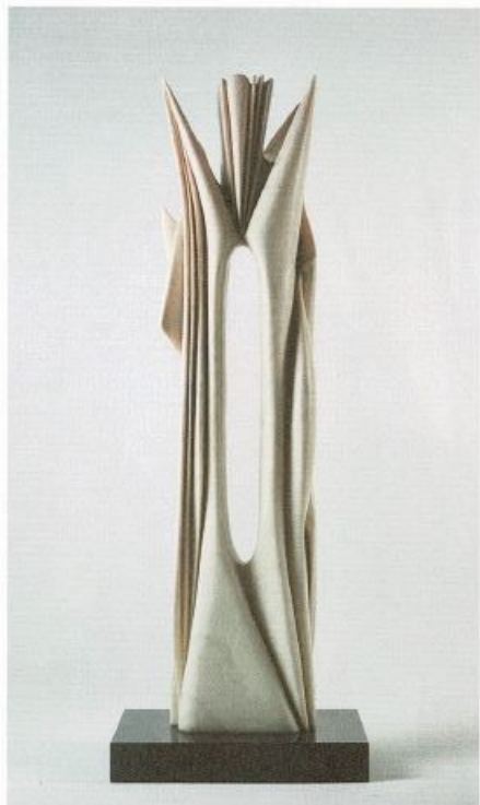
Pablo Atchugarry, Untitled , 2006, marmo statuario di Carrara / Statuary Carrara Marble, ed. unique, cm 107 x 25 x 14