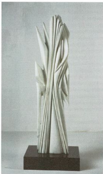
Pablo Atchugarry, Untitled , 2005, marmo rosa del Portogallo / Portugal Pink Marble, ed. unique, cm 170 x 40 x 24

dezza e sinuosità lucida del marmo rimanda a un immaginario intimo ed elegante.