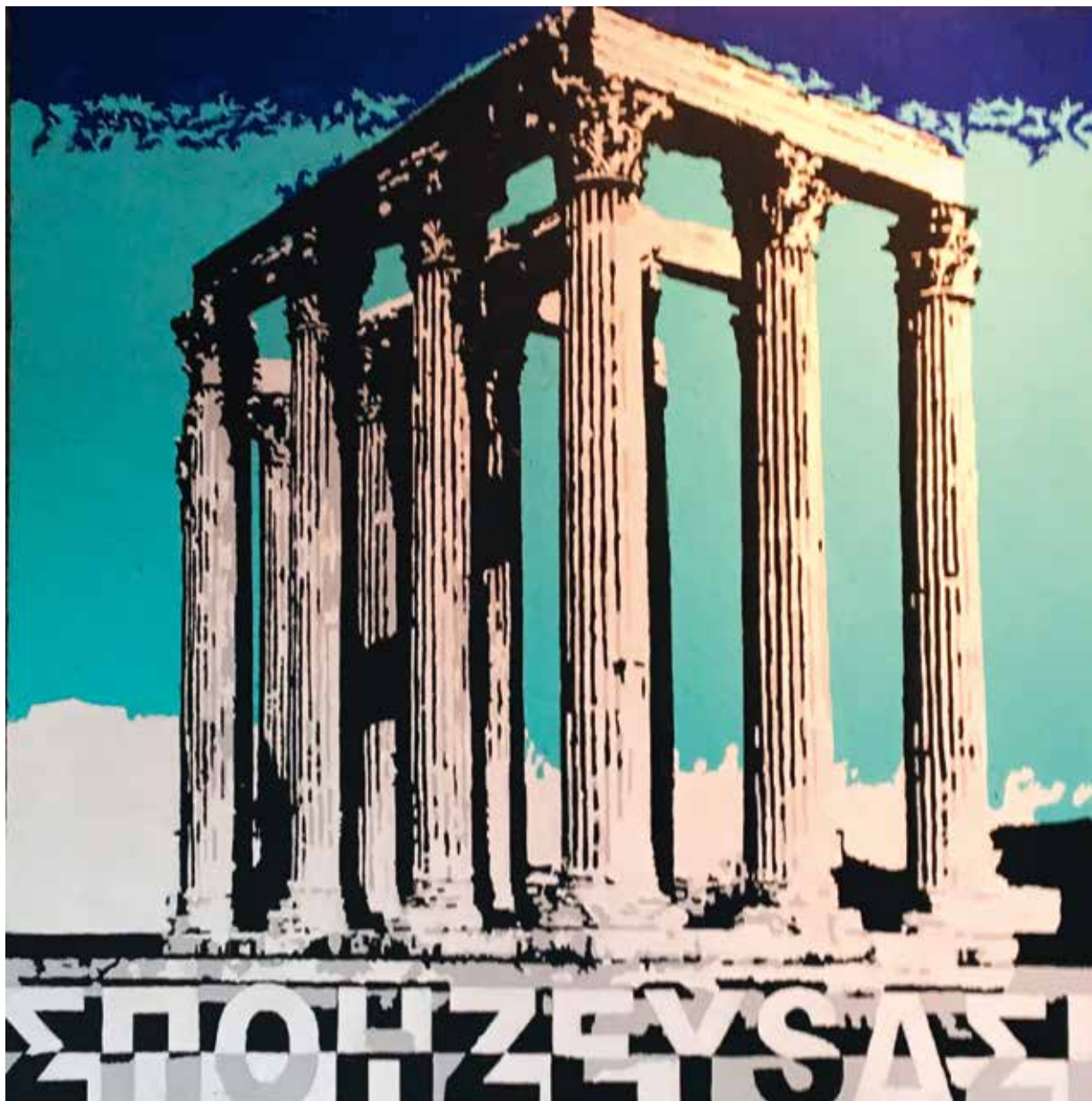
Andrea Valleri, "Ermeneutica del Classico (Tempio di Zeus ad Atene)", 2018, acrilico tecnica mista / Acrylic and mixed media on wooden board, cm 100 x 100