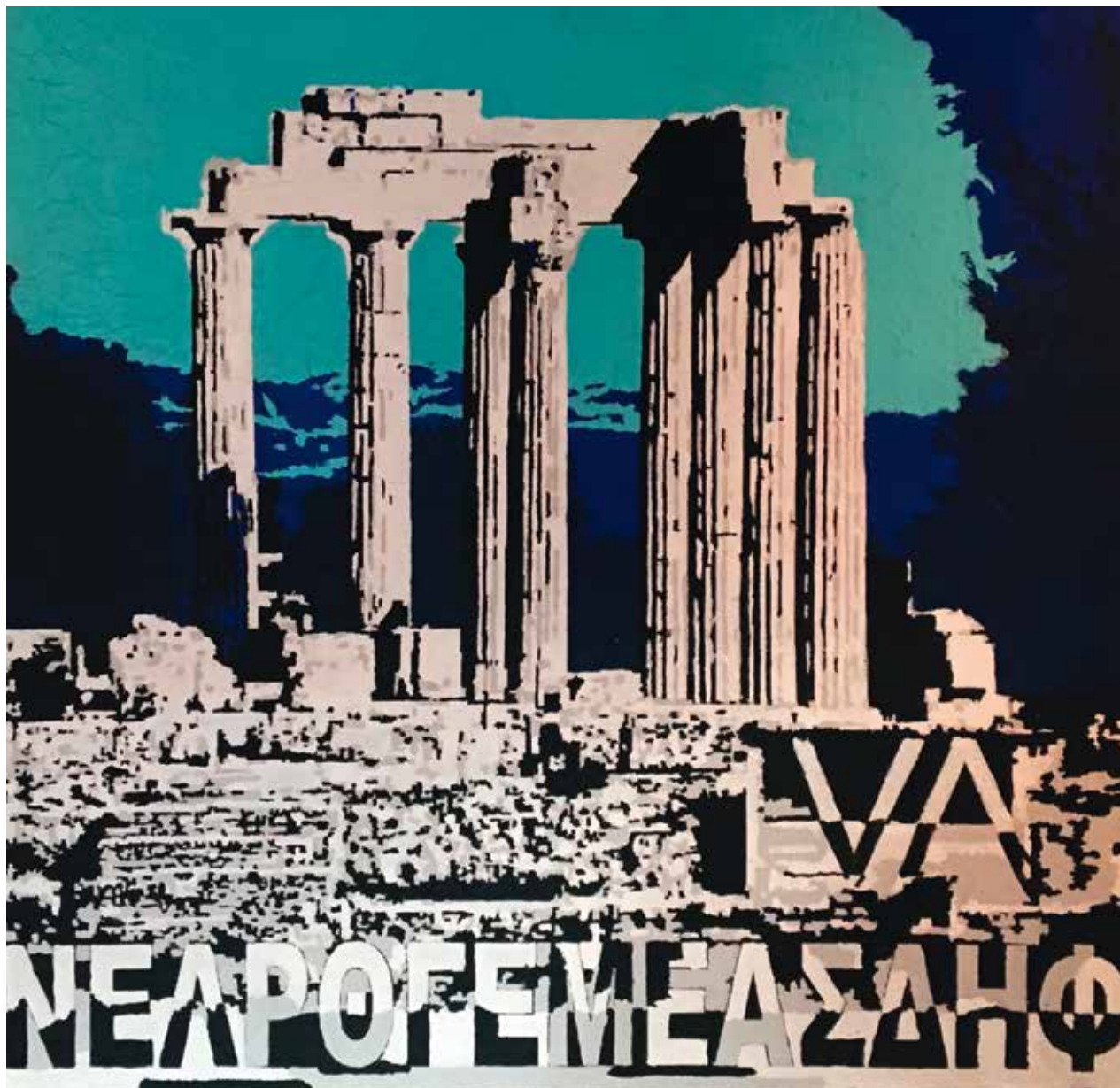
Andrea Valleri, "Ermeneutica del Classico (Nemea)", 2018, acrilico tecnica mista su tavola / Acrylic and mixed media on wooden board, cm 100 x 100