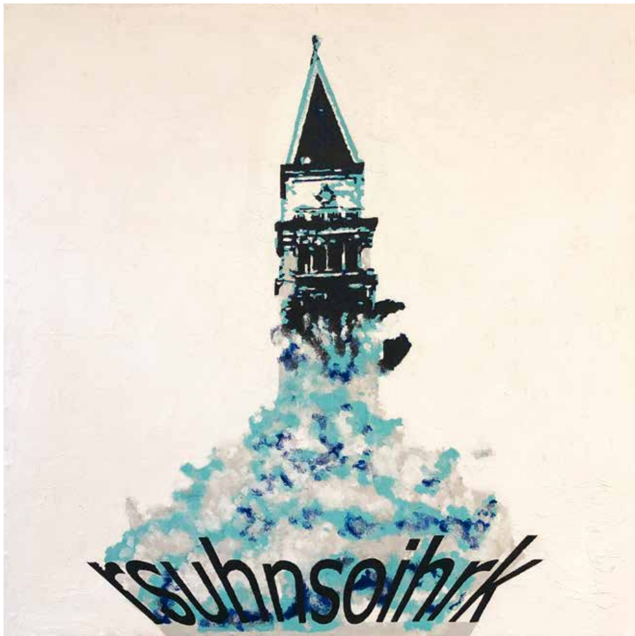
Andrea Valleri, "Ermeneutica del Classico (Nemea)" , 2018, acrilico tecnica mista su tavola / Acrylic and mixed media on wooden board, cm 100 x 100