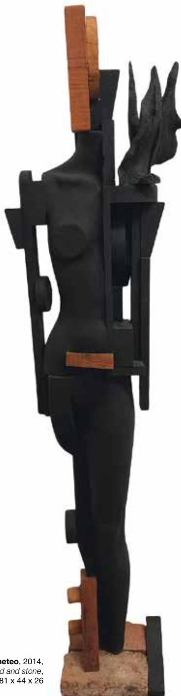
Andrea Valleri, Prometeo , 2014, legno dipinto e pietra / Painted wood and stone , cm 181 x 44 x 26