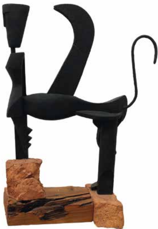
Andrea Valleri, "La Sfinge" , 2014, legno dipinto e pietra / Painted wood and stone , cm 54 x 39,5 x 14,5