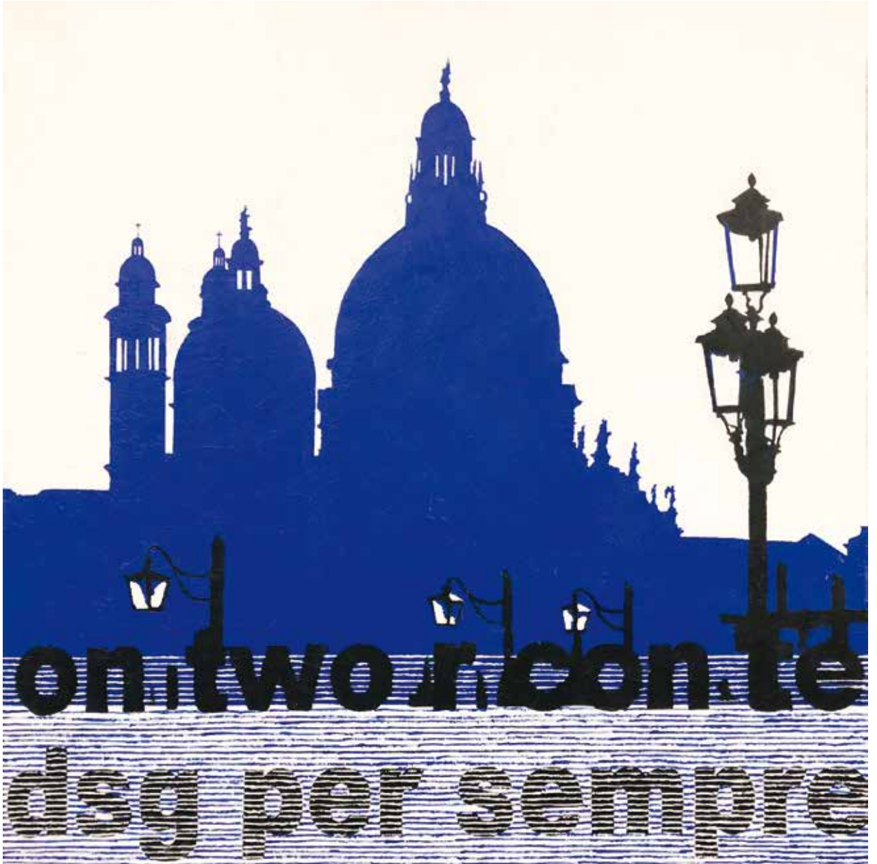
Andrea Valleri, "Ermeneutica della Storia" , 2018, tecnica mista su tavola / Mixed media on wooden board, cm 100x100