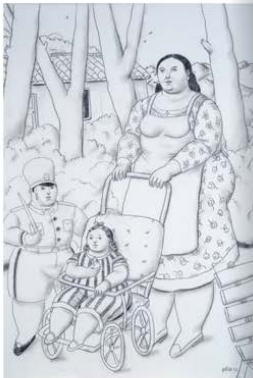
"The Nanny", 2012. Carbone su tela.

sensualità che si desidera". La Galleria d'Arte Contini ha reso omaggio ai suoi 90 anni con una personale a Venezia che racchiude il mondo stesso dell'artista nel susseguirsi di oli su tela, acquerelli, carboncini, disegni su carta e sculture in bronzo. In ogni suo dipinto, in ogni scultura, la forza poetica si manifesta pienamente, nell'unicità della sua espressione volumetrica che oggi viene chiamata "Boterismo". Botero dipinge e scolpisce seguendo un ideale di "sensualità della forma". Nella sua poetica, bellezza e sensualità si uniscono: la linea viene piegata e sagomata affinché lo sguardo scorra in un gioco di onde morbide e rassicuranti. Uno stile unico, attorno al quale il Maestro colombiano sviluppa la visione globale di un'arte senza confini e dal continuo richiamo alla classicità, in un'ottica assolutamente contemporanea. Botero riesce, nell'alterazione di volu-