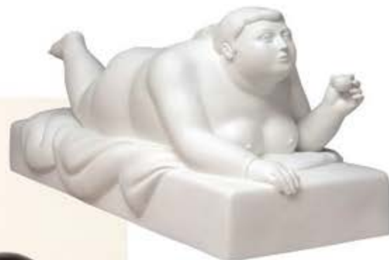
"Donna sdraiata con pallina", 2013. Bronzo dipinto.