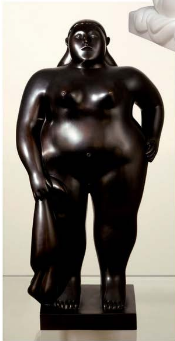
"Donna in piedi con panno", 2007. Bronzo.