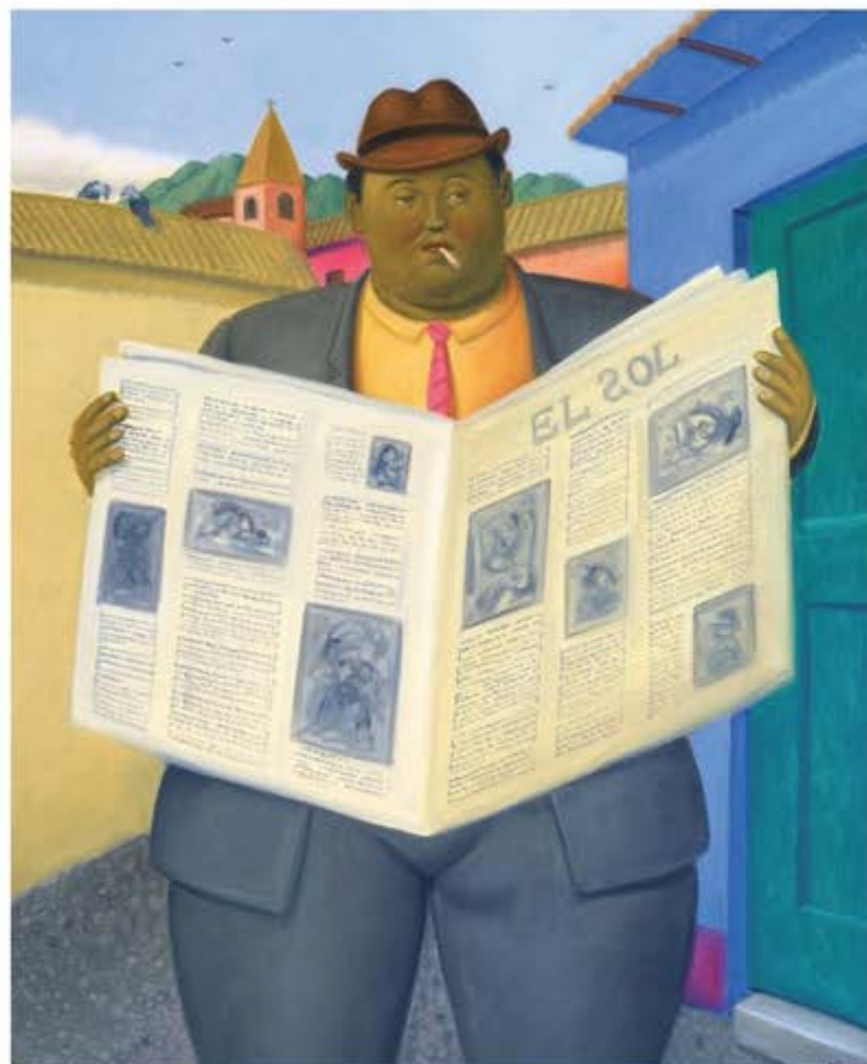
Pagina a sinistra: "The reader", 2013. Olio su tela.