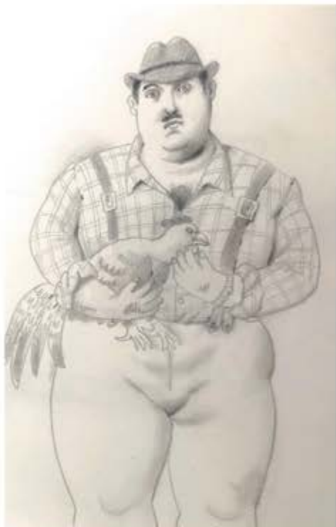
"Man with rooster", 2006. Matita su carta.